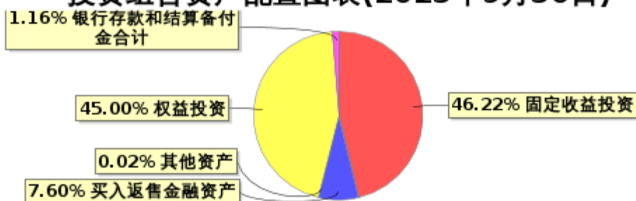
投资组合资产配置图表(2023年9月30日)