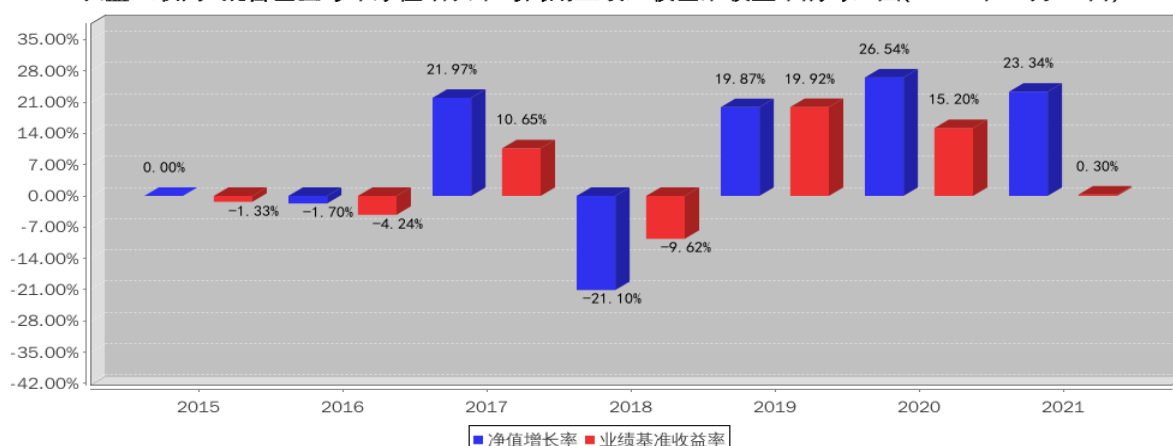
长盛互联网+混合基金每年净值增长率与同期业绩比较基准收益率的对比图(2021年12月31日)